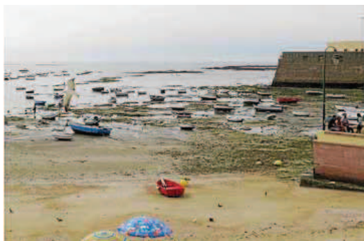
Als peus de la muralla urbana de Cadis la marea baixa deixa les barquetes en sec.